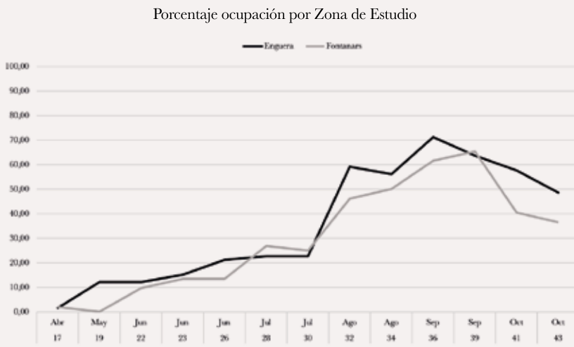
Figura 1: Evolución del porcentaje de ocupación de cajas nido en función de la zona de estudio en 2019 (Fontanars dels Alforins y Enguera).

Las cajas nido han tenido una ocupación muy superior a la registrada en programas similares en la Comunidad Valenciana. Solamente en un año se han establecido 5 colonias de cría, las cuales contaban con entre 30 y 50 individuos por caja. Los niveles máximos de ocupación de las cajas refugio fueron en los meses de agosto y septiembre con un porcentaje de ocupación superior al 70% (Fig. 1). Además, el 95% de las cajas colocadas han sido ocupadas en alguna ocasión, lo que refleja que el modelo, soporte y orientaciones escogidas son muy favorables para la conservación de los murciélagos en el territorio.