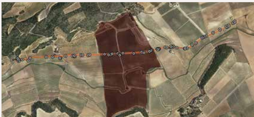
Figura 2: Transecto recorrido para medir la actividad de los murciélagos (línea roja) en la finca de Fontanars dels Alforins donde se colocaron las cajas refugio (marcada en rojo) y puntos donde se registró la actividad de los murciélagos (puntos blancos).